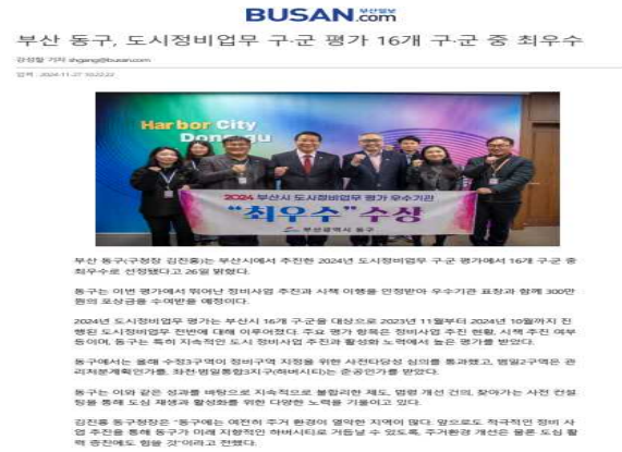
〈동구 내 재개발정비사업 추진 - 동구신문 10월 보도〉 〈2024년 도시정비업무 평가 최우수- 부산일보 11월 보도〉