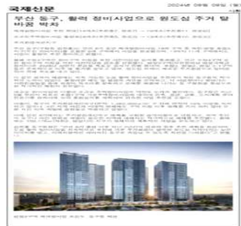
〈2023년 도시정비업무 평가 대상-2023. 11월 부산일보〉 〈동구 정비사업 추진 원도심 탈바꿈-2024. 9월 국제신문〉